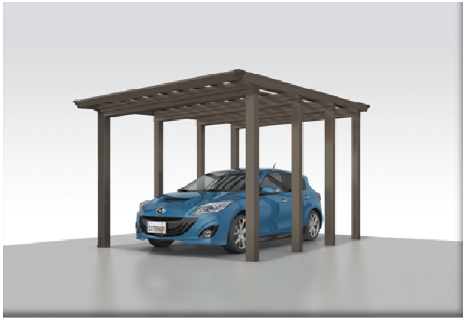
1 台用 5131-23H 耐積雪150cm デラックスタイプ